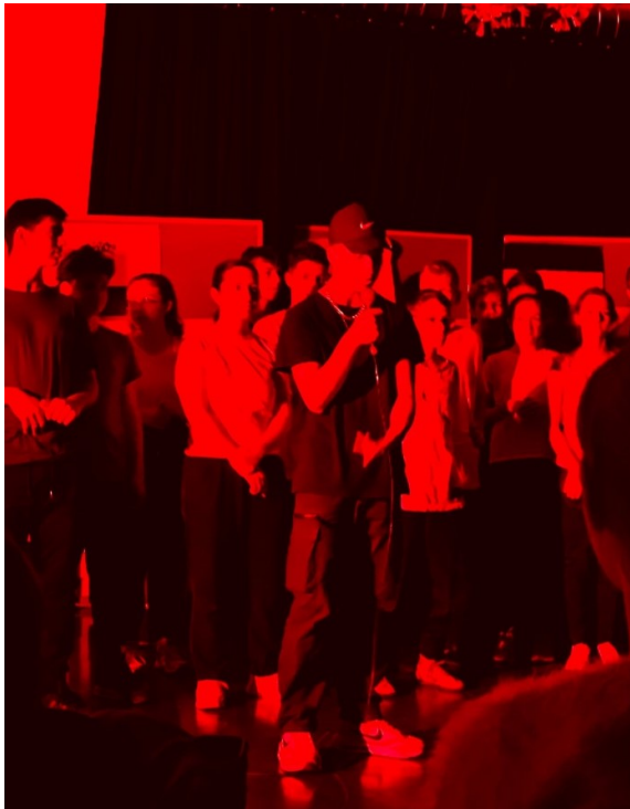
Es wurde geklatscht, mitgesungen und gar mitgetanzt und da und dort verdrückte ein stolzer Papa oder eine Mama ein Tränchen.